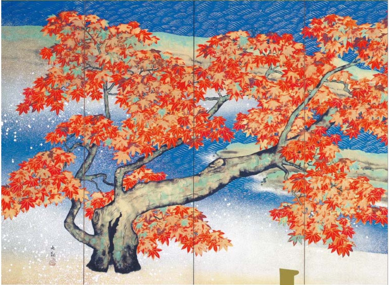
横山大観(紅葉)(左隻-部分) 1851(明治6)年 尾立美術館蔵